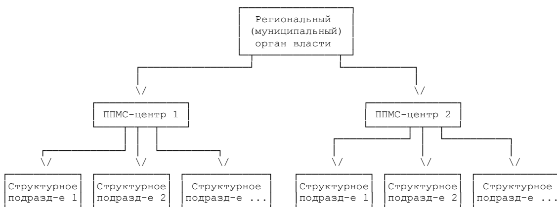
Рис. 1. Схема децентрализованной модели организации деятельности Центров

Модель подразумевает наличие в регионе нескольких Центров, имеющих статус юридического лица и включающих в себя ряд структурных подразделений, не являющихся самостоятельными юридическими лицами. Структурные подразделения могут выполнять сходные функции либо могут быть сфокусированы на выполнение определенного рода задач (например, диагностики, консультирования, профилактики и т.п.). Возможен вариант, когда часть подразделений выполняет сходные функции, а другая часть - профильные. В частности, структурное подразделение одного из Центров может выполнять функции методического обеспечения по отношению к психологическим службам образовательных организаций региона. Также на одно из структурных подразделений того или иного Центра может быть возложено осуществление функции психолого-медико-педагогической комиссии. Кроме этого, в образовательных организациях психолого-педагогическое сопровождение реализации основных общеобразовательных программ могут осуществлять специалисты этой же организации.