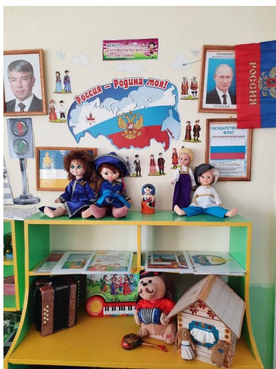
Центр патриотического воспитания в средней группе «Сказка»